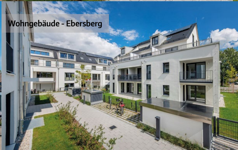
Wohngebäude - Ebersberg