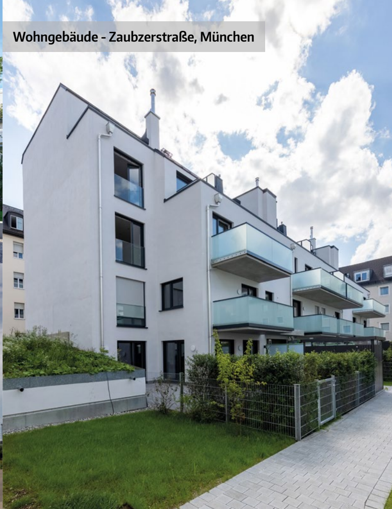
Wohngebäude - Zauberstraße, München